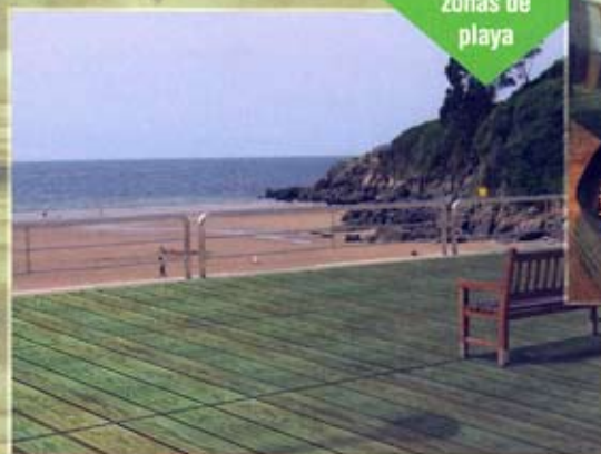
zonas de playa